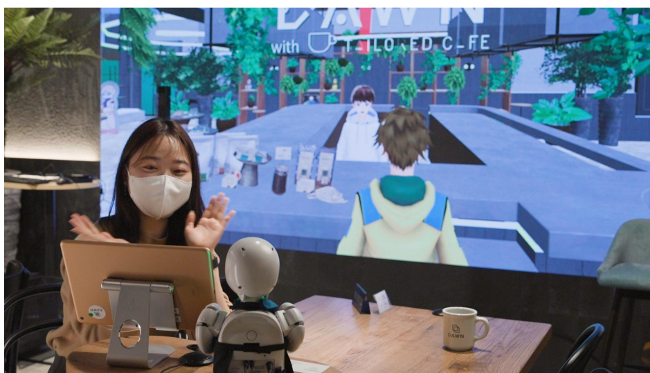
アバターロボット（写真手前）で接客中のパイロットが 背面のバーチャル環境でバーチャルアバターになって接客する様子