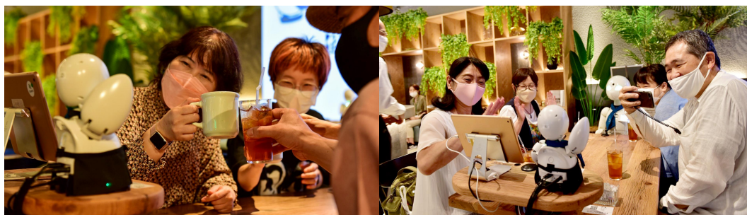
「複数アバター分身実験」の様子（2022年6月）

これまでも、分身ロボットカフェ DAWN ver. \beta を舞台にパイロットがカフェ空間において複数のロボットアバターを操作し、テーブル接客をしながら配膳をするなど、複数の接客を同時に行える「複数アバター分身実験」（2022年6月）や、パイロットの共創により互いの個性や得意不得意をかけ合わせパンケーキのトッピングを行う「融合アバター共創実験」（2022年11月）などを実施してきました。