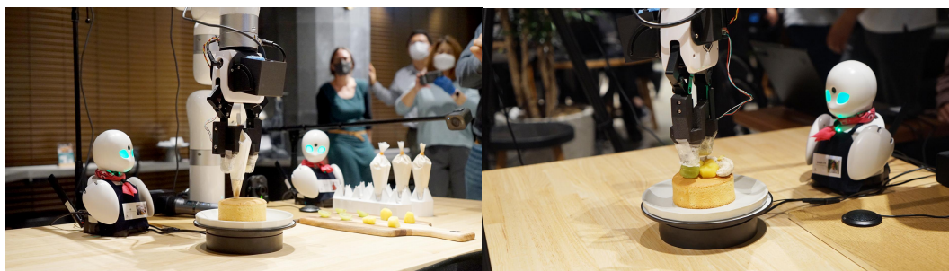
「融合アバター共創実験」の様子（2022年11月）

これらの取り組みに加えて、今回新たに、パイロットの個性や顧客とのコミュニケーションニーズに合わせて身体外観を変更可能なバーチャルアバターを活用した、バーチャルカフェを通じた接客サービスを導入します。バーチャルアバター技術、複数並列技術、技能融合技術と、3つのサイバネティック・アバター技術を用いる事によって、パイロットの創造的な労働環境を構築すると同時に、カフェの来店客により一層充実した体験を提供するサービスの実現を目指します。